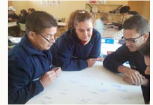
La Emprendeduría: creación de empresas.