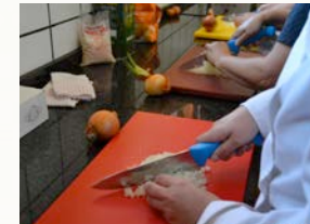
Operaciones básicas de cocina: practicando los tipos de corte

Dentro del itinerario formativo del Taller de Empleo ALRUTE tiene especial importancia el desarrollo de las prácticas, formulándose como unidades de obra o productos que complementan y afianzan los contenidos teóricos impartidos.