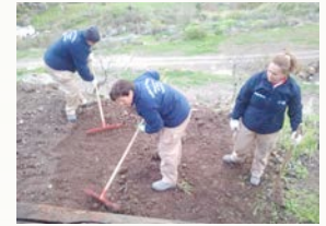
Embellecimiento de distintas zonas del Albergue