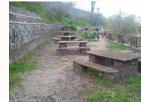
Alrededores de Tejada